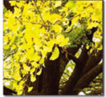
Günümüz ginkgo ağaçları

Dönem: Senozoik zaman, Eosen dönemi Yaş: 50 milyon yıl Bölge: Kanada